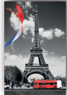
Stor 150 x 230 cm