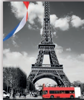
Stor 150 x 175 cm

En dépendant de la taille de son estor, l'image restera d'une manière ou d'une autre. Nous joignons à une lettre un exemple :