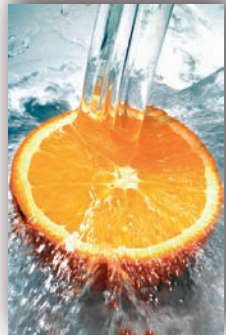
Stor 150 x 230 cm

A seconda delle dimensioni del vostro tessuto, l'immagine sarà realizzata in un modo o nell'altro. Esempio: