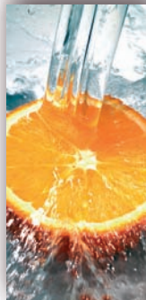
Stor 110 x 230 cm